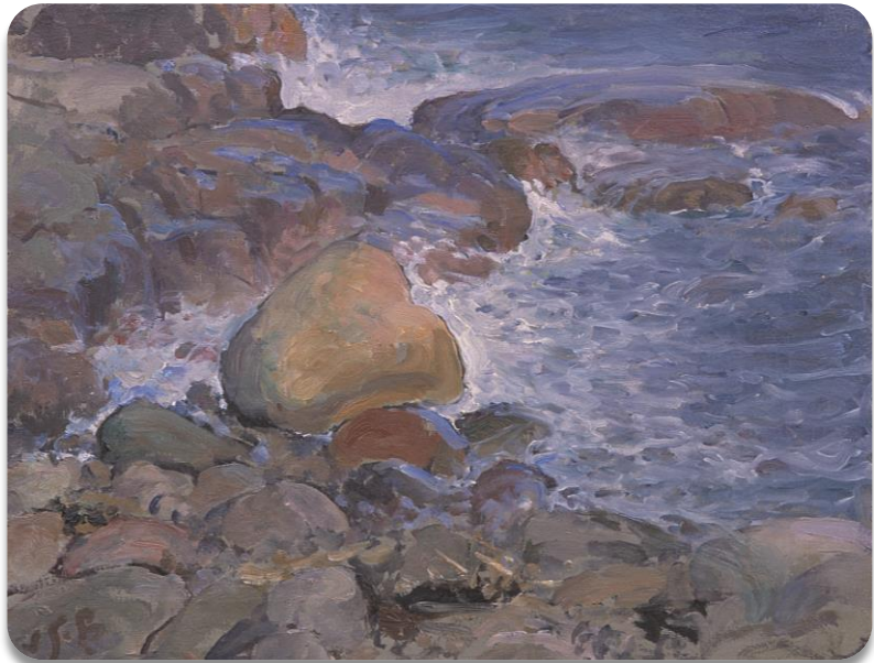
Kansikuva: Rantakalliot, OLVI-säätiön taidekokoelma, Venny Soldan-Brofeldt

Venny Soldan-Brofeldt (1863–1945) tunnettiin vuosikymmenet vain kirjailija Juhani Ahon puolisona ja Pariisin maailmannäyttelyssä vuonna 1900 pronssia voittaneen Heränneitä-teoksen maalaajana.