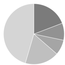
Alternatiivien allokaatio %