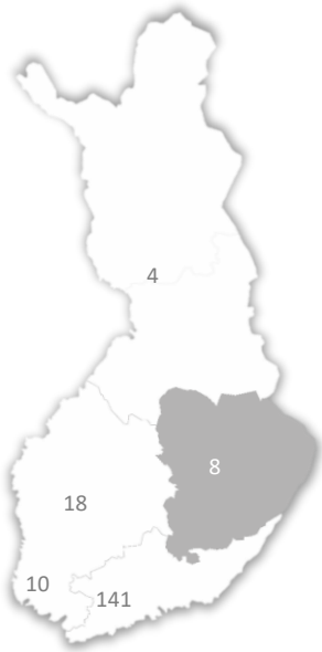
Säätiöt ja rahastot jäsenet

Lokakuussa 2020 Gaia Consulting selvitti Säätiöt ja rahastot ry:n jäsenten myöntämän säätiötuen euromäärän ja merkityksen tieteelle, taitelle ja yhteiskunnan muulle kehittämiselle Suomessa.