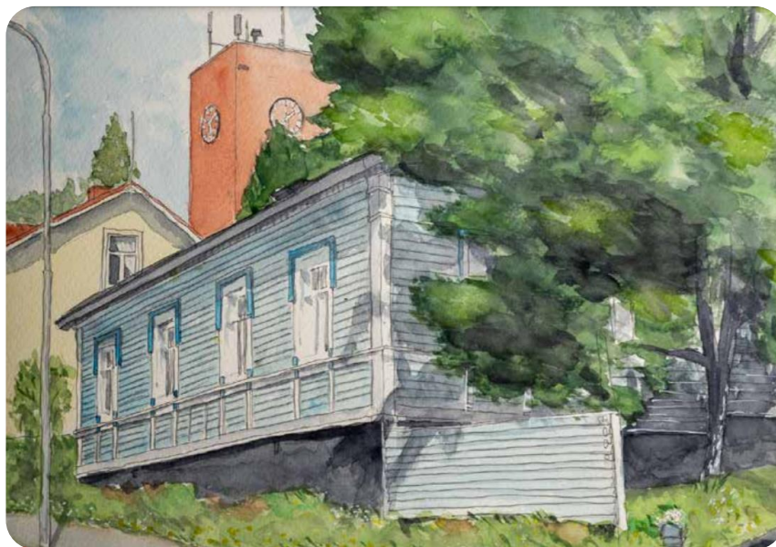
Kansikuva: Iisalmen vanhat puutalot –akvarellikokoelma: Haukiniemenkatu, Iisalmi, Akvarelli: Pentti Koppinen 2020