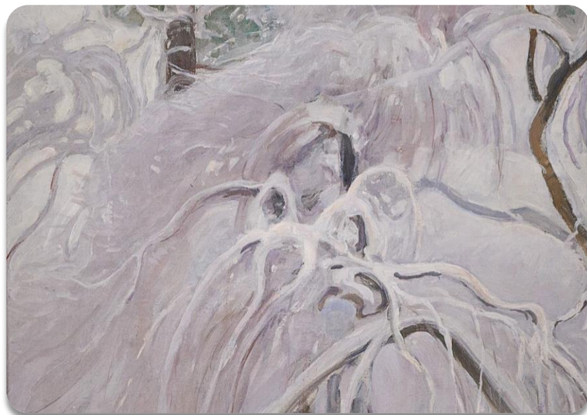
Kansikuva: Lumisia puita, OLVI-säätiön taidekokoelma, Pekka Halonen, 1919, öljy kankaalle

Teoslainat Taidemuseo Eemiliin vuonna 2021